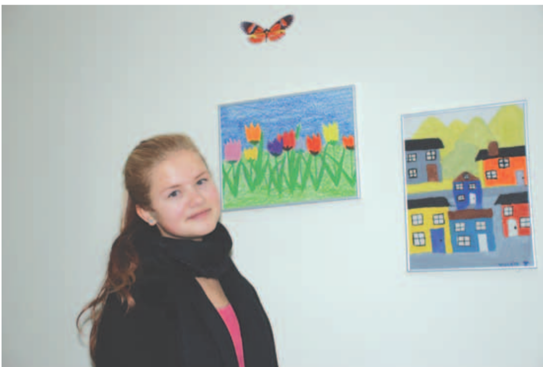
Koduseinad on kaetud Violeta joonistustega